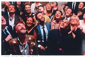
© 2017 - DUO - TEN - TEN FILMS - GARAGNET - FFI FILMS PRODUCTIONS - PARACHE PRODUCTIONS - LA COMPAGNIE CINEMATOGRAPHIQUE

公開2018年/製作2017年/フランス/117分/監督:エリック・トレダノ、オリビエ・ナカシュ/出演:ジャン=ピエール・バクリ、ジル・ルルーシュ、ジャン=ポール・ルヴ ほか